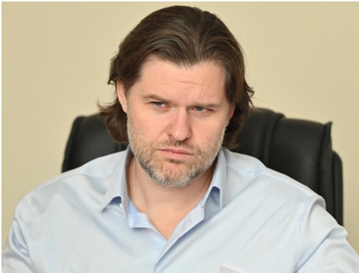
Иллюстрация: ГК "Кашалот"

Реформирование в сфере обращения с ТКО идет уже несколько лет. Но его результаты далеки от ожиданий людей и игроков этого рынка. Проблема в выбранном векторе развития.